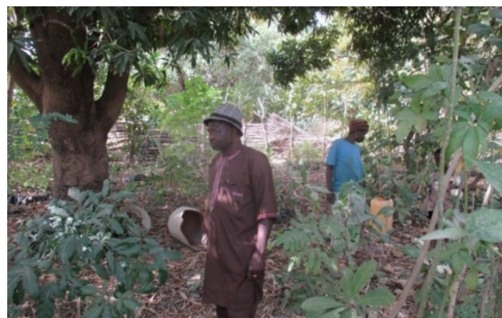
Ca. 30 Jahre alte Mangobäume in Soroko in der Nähe von Banikoara, die mit Hilfe von Pro Benin gepflanzt wurden

Um möglichst viele Pflanze unterstützen zu können, werden kontinuierlich neue Dörfer in das Programm aufgenommen.