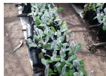
Setzlinge junger Cashew-Pflanzen