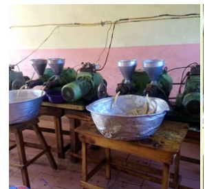
Pressen der Sojabohnen

Seit Bestehen des Vereins unterstützt dieser die Dorfgemeinschaft Soyo in Allada, die Sojabohnen zu hochwertigen proteinhaltigen Nahrungsmitteln verarbeitet. Diese sogenannten "Goussis", die sehr wertvoll für die Gesundheit sind, werden auf Märkten und im Direktverkauf im Süden von Benin seit vielen Jahren erfolgreich verkauft. Sie sind eine sehr gute Alternative zu dem teuren Fleisch oder Fisch.