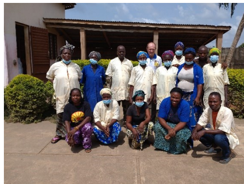
Das Team der Genossenschaft

In der Genossenschaft sind derzeit 15 Personen in Vollzeit beschäftigt, die durch ihren Verdienst ihre Familien und damit ca. 100 Personen ernähren.