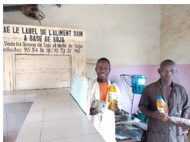
Verkaufsraum der Genossenschaft

Der Genossenschaft gelingt es seit über 20 Jahren, mit eigenen Mitteln die Ausgaben für Löhne, Sozialabgaben sowie den täglichen Geschäftsbetrieb zu finanzieren.