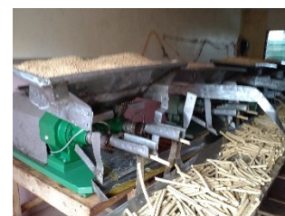
Pressen der Sojabohnen

Seit Bestehen des Vereins unterstützt dieser die Dorfgenossenschaft Soyo in Allada, die Sojabohnen zu hochwertigen proteinhaltigen Nahrungsmitteln verarbeitet. Diese sogenannten "Goussis", die sehr wertvoll für die Gesundheit sind, werden auf Märkten und im Direktverkauf im Süden von Benin seit vielen Jahren erfolgreich verkauft. Sie sind eine sehr gute Alternative zu dem teuren Fleisch oder Fisch.